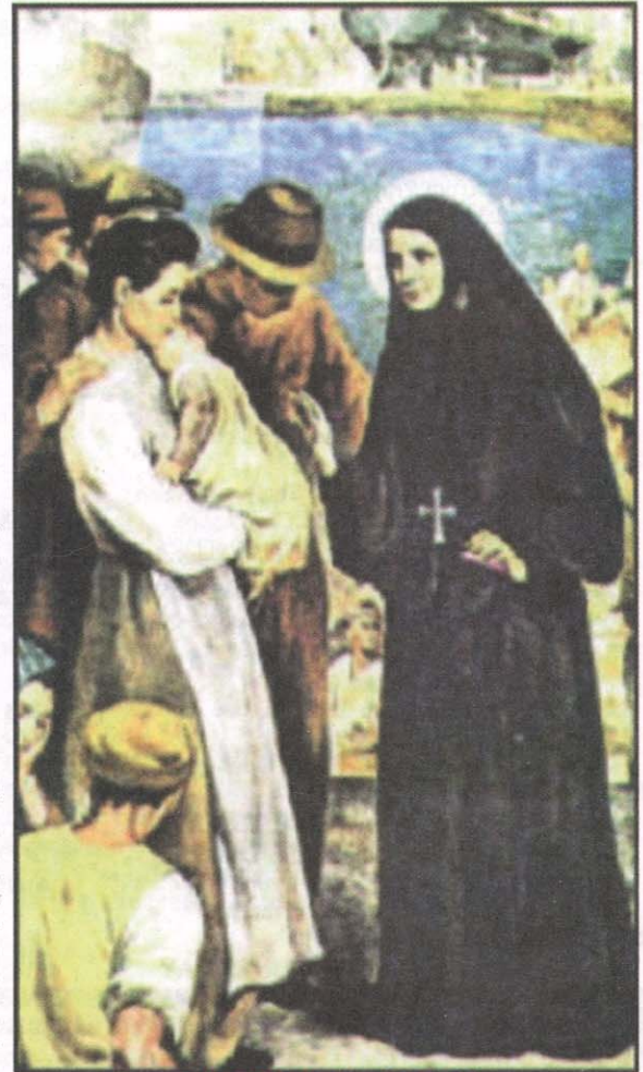
UNA FAMILIA - UNA FE ONE FAMILY - ONE FAITH